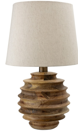
Table Lamp 82046379

ESPAÑOL - INFORMACIÓN IMPORTANTE Lea el manual completo antes de usar este producto. Siga el manual detenidamente y guárdelo para futuras consultas. Desconecte siempre el interruptor general de la electricidad antes de iniciar cualquier trabajo de instalación. Solo para uso en interiores.