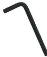
III Small Allen Key 1X