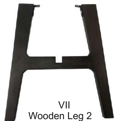
VII Wooden Leg 2 1X(44x2.5x48cm)