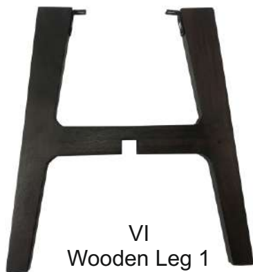
VI Wooden Leg 1 1X(44x2.5x48cm)