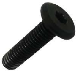
I Large Allen Bolt 1X(16Øx33mm)