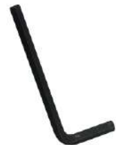
IV Large Allen Key 1X