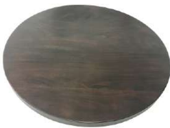
V Wooden Top 1X(45Øx2.5cm)