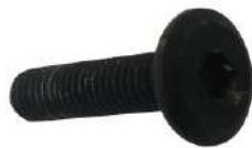
II Small Allen Bolt 4X(12.5Øx23mm)