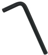
II Allen Key 1X