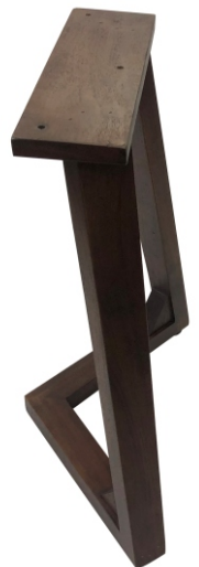
IV Wooden Leg 2X(32x22x38.5cm)