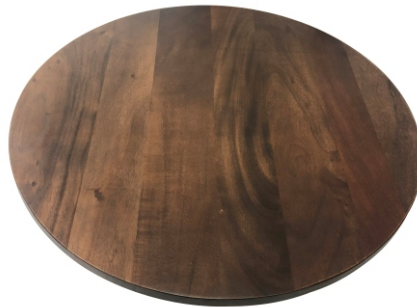
III Wooden Top 1X(50Øx1.5cm)