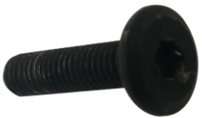
I Allen Bolt 6X(12.5Øx23mm)